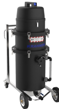
NEF 230/2 PE AK