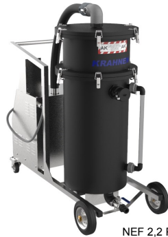
NEF 2,2 PE AK