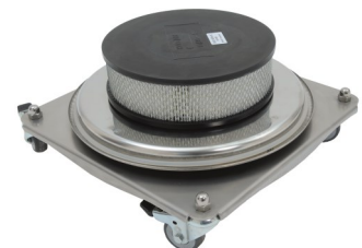
Filter H 14 nach dem Motor