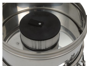
H12 Filter vor dem Motor (Ausführung SZB mit H 14)