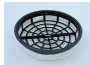
L-Filter mit Stützkorb