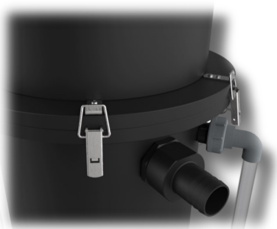
Ansaugreduzierung aus PE am Sauger montiert