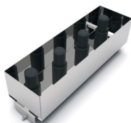
Zubehörkorb für Saugset