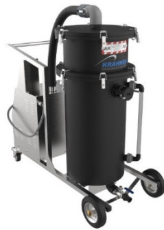
NEF 2,2 PE AK

Elektrosauger für den Nassbetrieb zur Aufnahme von aggressiven, nicht brennbaren Flüssigkeiten. Alle medienberührenden Bauteile aus säurefestem Kunststoff Polyethylen.