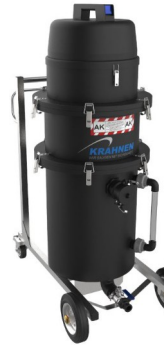
NEF 230/2 PE AK

Die robusten und innovativen KRAHNEN Industriesauger bieten bei der Aufnahme von nicht brennbaren Flüssigkeiten ein Höchstmaß an Sicherheit, Zuverlässigkeit und Qualität. Die umfassenden Serviceleistungen runden unser Produktangebot ab.