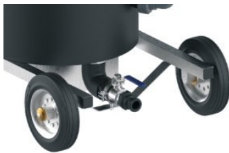
Ablaufkugelhahn mit Rammschutz

Der Betreiber hat die entsprechende Auswahl eigenverantwortlich zu treffen. Zu dem jeweiligen Anforderungsprofil erhalten Sie von der KRAHNEN GmbH eine Empfehlung mit dem entsprechenden Aktivkohletyp und einen darin enthalten Kapazitätsindex.